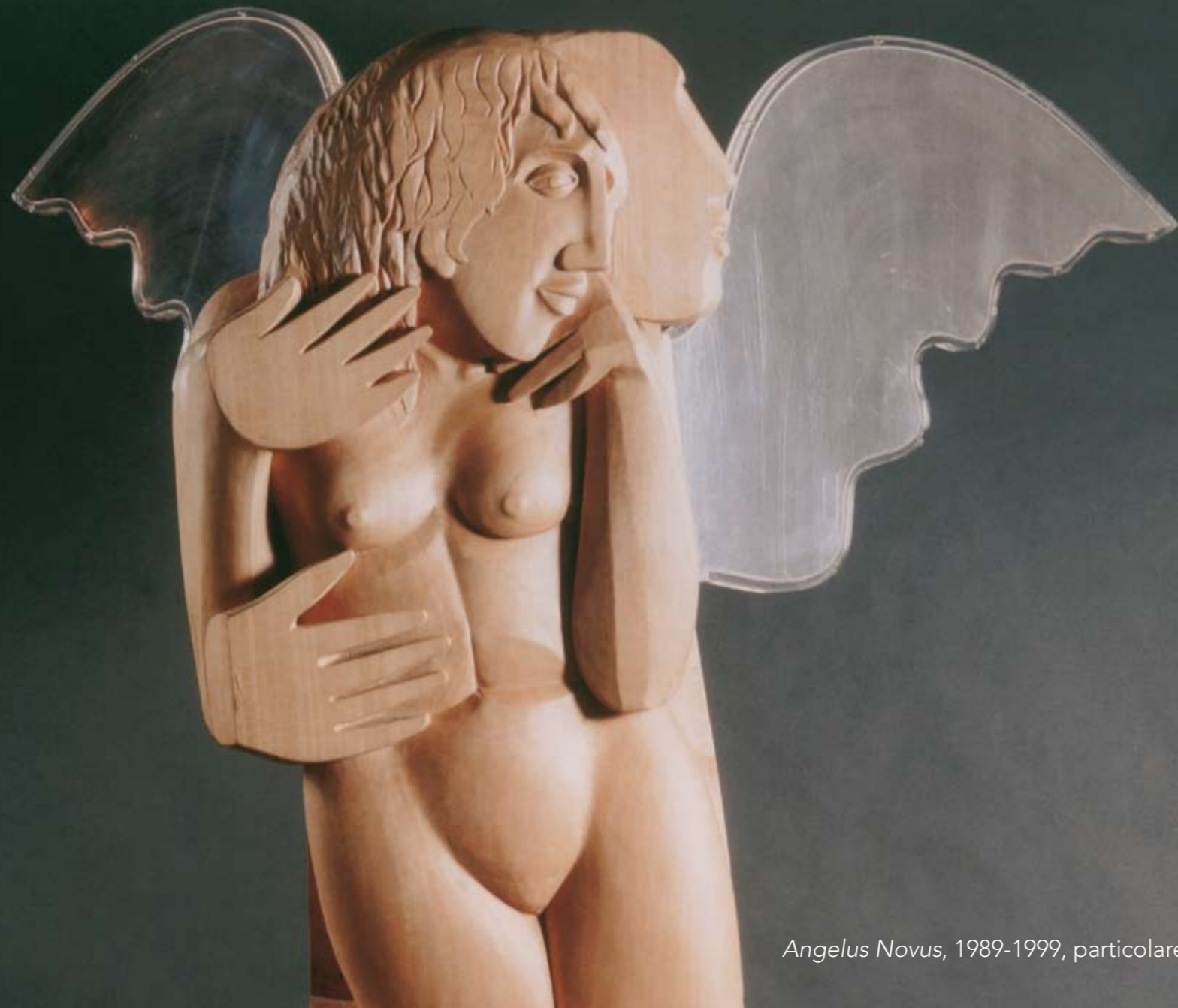
Angelus Novus, 1989-1999, particolare