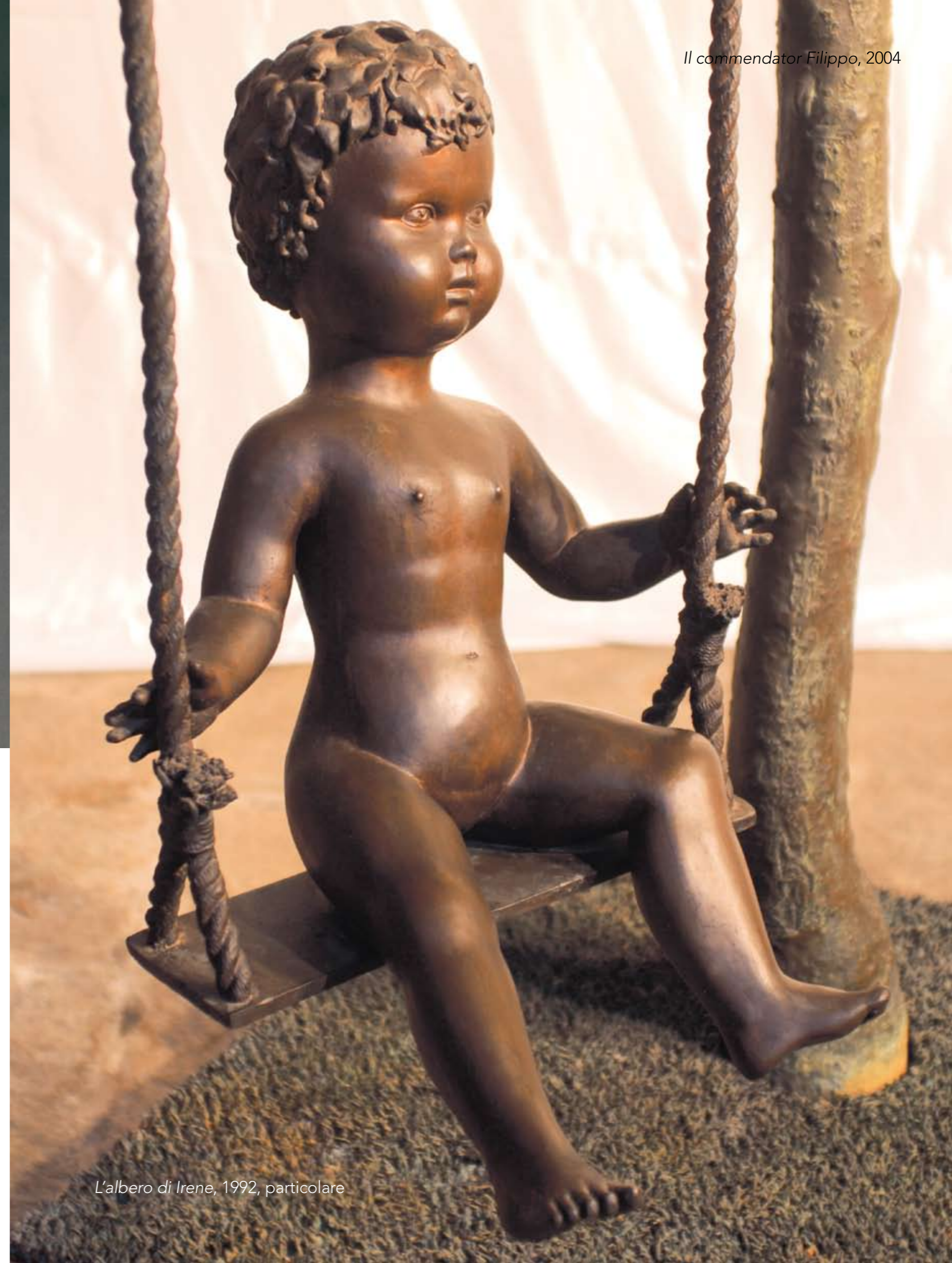
L'albero di Irene, 1992, particolare