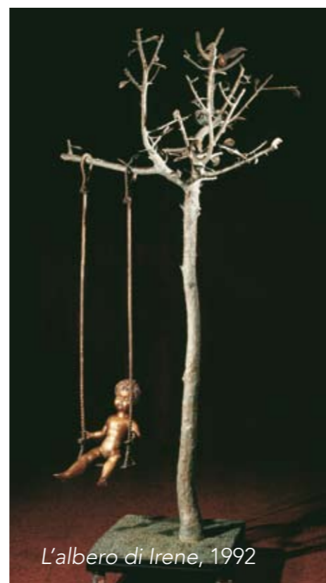
L'albero di Irene, 1992