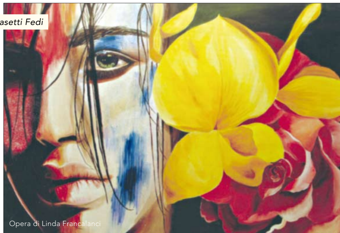
Opera di Linda Francalanci

Ricordare le origini della festa dell'8 Marzo vuol dire aver ben presenti i motivi che hanno portato le donne e gli uomini che le hanno sostenute a lottare negli anni contro lo sfruttamento, le discriminazioni, la violenza sessuale ed anche oggi a favore di una società più giusta, più equa. Nel 1908, a New York, le operaie dell'industria tessile Cotton scioperarono per protestare contro le terribili condizioni in cui erano costrette a lavorare. Lo sciopero si protrasse per alcuni giorni, finché l'8 marzo il proprietario, Mr. Johnson, bloccò tutte le porte della fabbrica per impedire alle operaie di uscire. Allo stabilimento venne appiccato il fuoco e le 129 operaie prigioniere all'interno morirono arse dalle fiamme. Successivamente questa data venne proposta come giornata di lotta internazionale per i diritti delle donne proprio in ricordo della tragedia. È trascorso un secolo da quel giorno e tante conquiste sono state fatte da parte delle donne ma il cammino è ancora lungo. Basta pensare che in Italia i risultati delle inchieste di governo hanno accertato che ogni due giorni una donna viene uccisa in casa e che due milioni 938mila nel 2006 hanno denunciato violenza sessuale o maltrat-